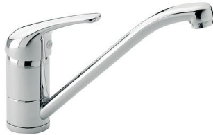
Mischbatterie S1000 - RO 8443 002